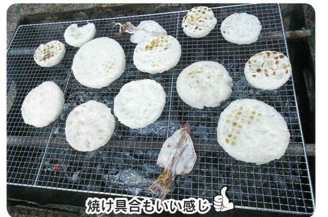
焼け具合もいい感じ

一月十二日、裏の駐車場にてどんどやを行いました。お正月飾りを焚き上げ、勢いよく燃えるやぐらから「パーン！」という音が聞こえると、「これこれ、この音がよかったです」と、年神様が空へ帰って行くのをお見送りし、無病息災やコロナ収束を祈願しました。