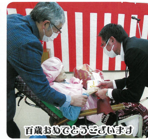
百歳おめでとございます