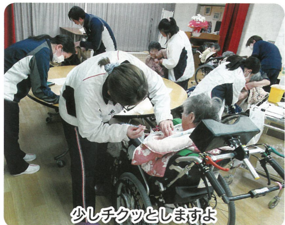
少しチクツとしますよ