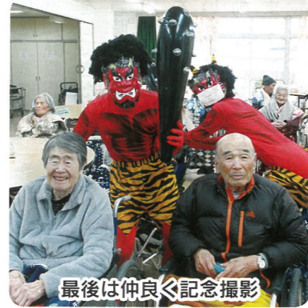
最後は仲良く記念撮影

二月十七日、今年度二回目のおやつバイキングを実施しました。今回は、ワッフル・コーヒー牛乳プリン・りんごジュースゼリーの三種をご用意し、お好きなデザートの一つを選んでいただきました。りんごジュースゼリーは、まるでビールのような出来映え！「毎回の日がとっても楽しみ。どれにしようかな？」と、早くも次回を楽しみにされています。