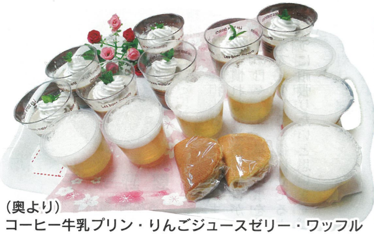
(奥より) コーヒー牛乳プリン・りんごジュースゼリー・ワッフル