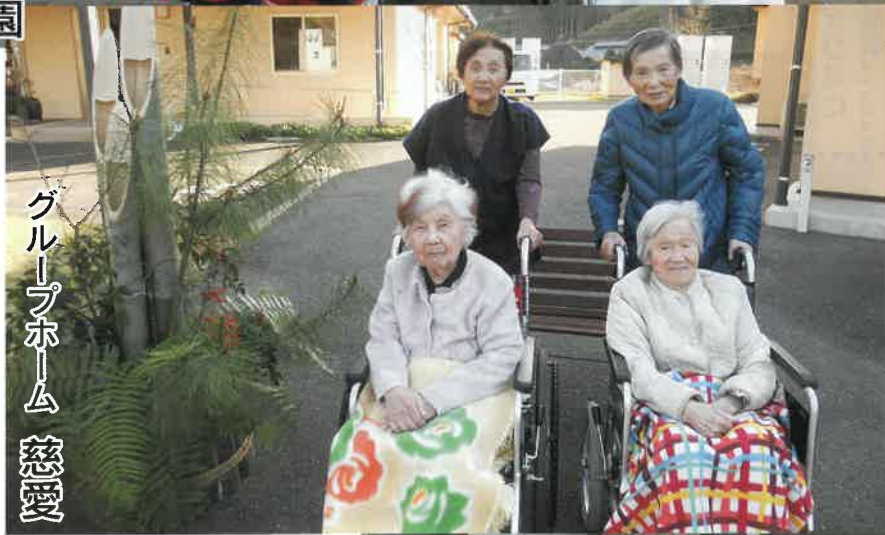
グループホーム 慈愛