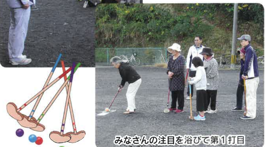
みなさんの注目を浴びて第1打目