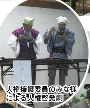
人権擁護委員のみな様による人権啓発劇