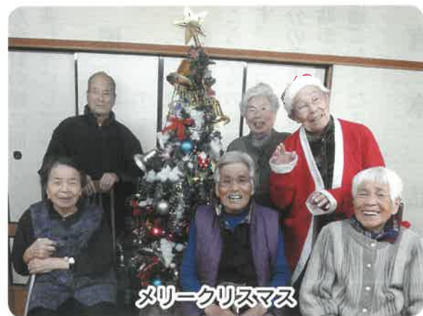
メリークリスマス

十二月十四日の夕食のメニューは、クリスマススイブにピツタリの骨付チキン・ポテトサラダ・オニオンスープでした。普段はおしとやかな方もチキンを握りしめ、大きく口を開けかぶりつき夢中になつて食べておられました。サンタクロースも登場し、楽しい美味しいクリスマスでした。