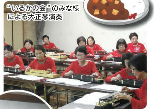
“いるかの会”のみな様による大正琴演奏