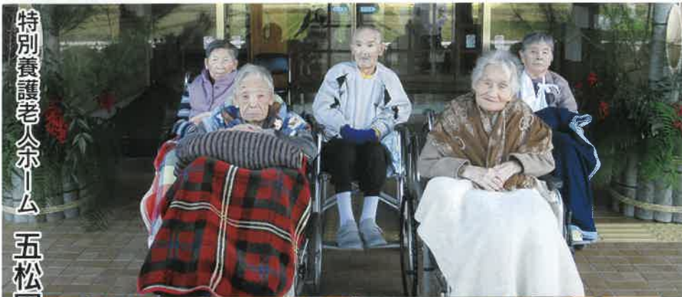
特別養護老人ホーム 五松園

発行／社会福祉法人 慈友会 芦北郡芦北町大字花岡1118 ☎0966-82-4274 印刷／(有)芦北総合印刷