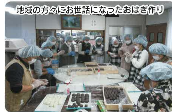
地域の方々にお世話になったおはぎ作り

十一月十八日に、花岡東地区との合同文化祭を開催しました。今年のテーマは「宇宙(そら)へ」玄関から入ると、地球を取り囲む惑星に映えて、宇宙飛行士となつたくまモンが出迎えてくれました。又、作品展示物は利用者様と職員の力作が並び、バザー会場ではおはぎと唐揚げはすぐに完売し、うどんとカレーも大好評でした。