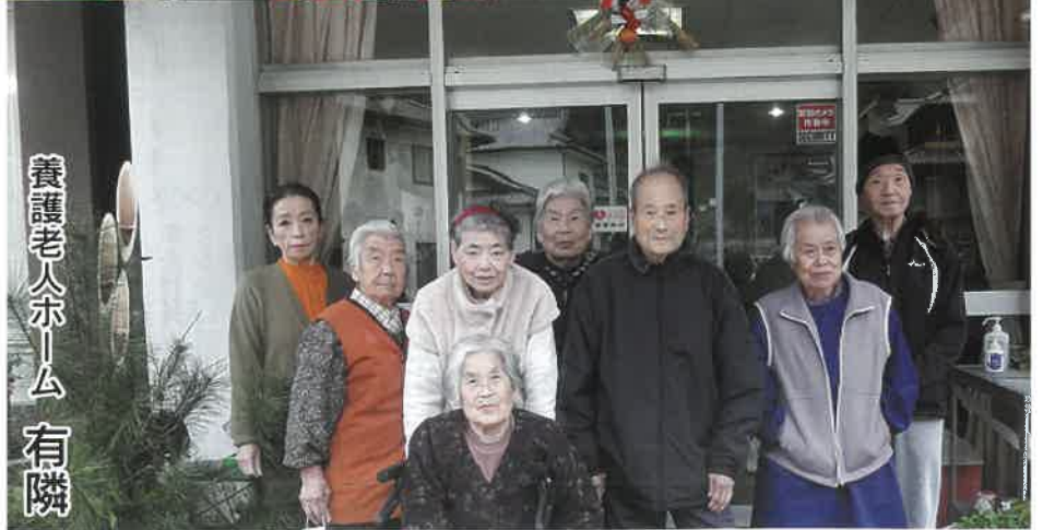
養護老人ホーム 有隣