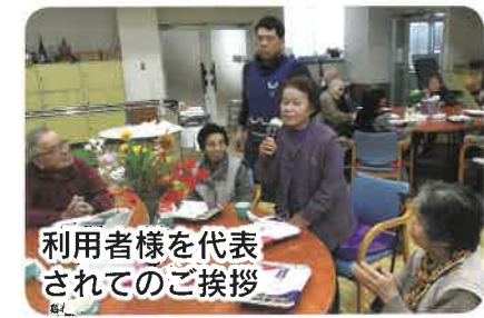
利用者様を代表されてのご挨拶

昨年も沢山の方に五松園デイサービスセンターをご利用いただき有り難うございました。十二月十六日(土)と十七日(日)の二日、忘年会を開催しました。職員による寸劇「浦島太郎」では、お腹を抱えて大笑いされ、又唄や踊りで賑わい、楽しんでいただけようです。最後に少し早めのクリスマスケーキを食べ、会を締めくくりました。