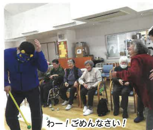
わー！ごめんなさい！

職員扮する赤鬼と青鬼目掛けて、「鬼はー外！福はー内！」とリハビリを兼ねて必死に投げると、鬼はみな様のパワーに負けてたじたじでした。 今年も無病息災で過ごせますように。