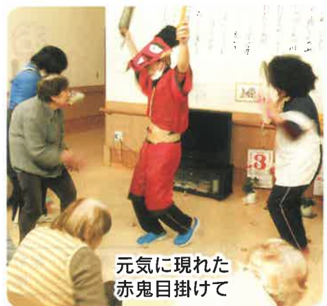
元気に現れた赤鬼目掛けて

二月三日節分の日に、今年も慈愛に鬼と福がやってきました。迫力のある鬼が登場すると、「鬼は外！福は内！」と手に持った豆袋を一生懸命投げられ、今年一年の健康を祈りましました。 又この日の昼食には、職員手作りの「恵方巻き」を食べられ、「美味しい、美味しい。」と、沢山の笑顔溢れる節分の日となりました。