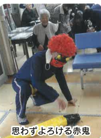
思わずよろける赤鬼