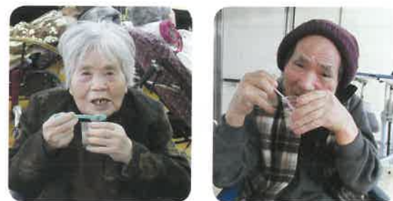
美味しそうなおやつが並びました

毎回、利用者のみな様が楽しみにしていらつしゃるおやつバイキングを、二月二十二日に行いました。 今年度二回目、 「この日が来るのを楽しみにしてました。」 「見た目も華やかで、とても美味しかったです。」 と、大好評でした。