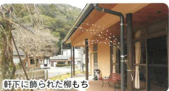
軒下に飾られた柳もち

「よか出来ね〜」とみな様笑顔で話しておられ、道行く人も足を止めて眺めておられました。