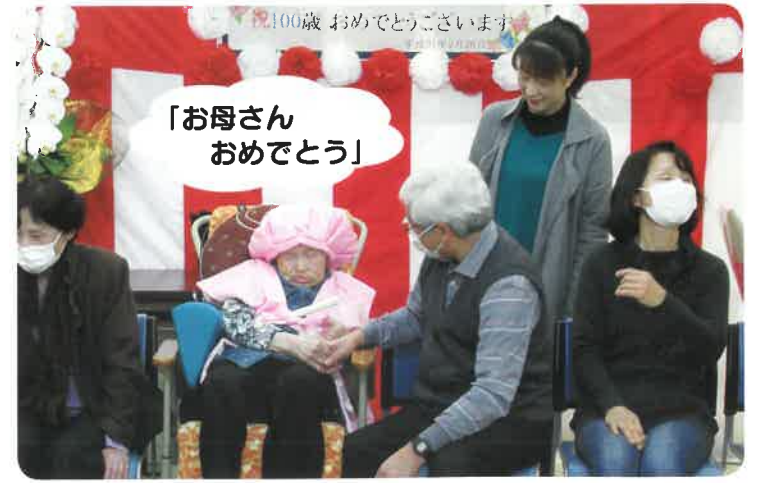
「お母さんおめでとう」